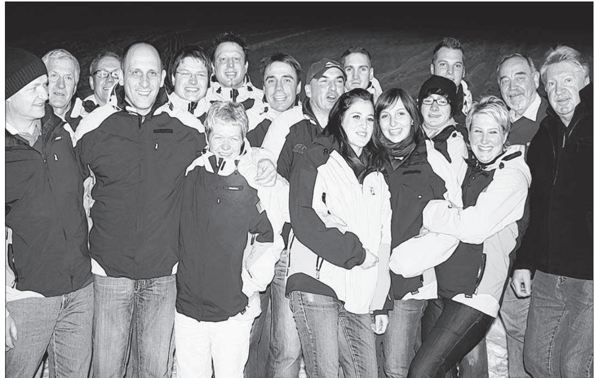
Über eine bisher gute Saison freut sich der Skiclub Königsbronn. Dank gut vorbereiteter und ausgebildeter Skilehrer konnte in der DSV-Skischule vom Anfänger- bis zum Carvingkurs alles geboten werden, was das Skifahrerherz begehrt.

Eine Mutter beklagte sich über den Zustand der Fenster in diesem Kindergarten direkt neben dem Dorfhaus. Die Fenster seien blind und ohne Durchblick. Sie sollten ausgetauscht werden. Dies sei für 2011 vorgesehen, antwortete Bürgermeister Schaller unter Hinweis auf den Investitionsplan der Gemeinde im Rahmen der aktuellen Haushaltsplanung. kdk